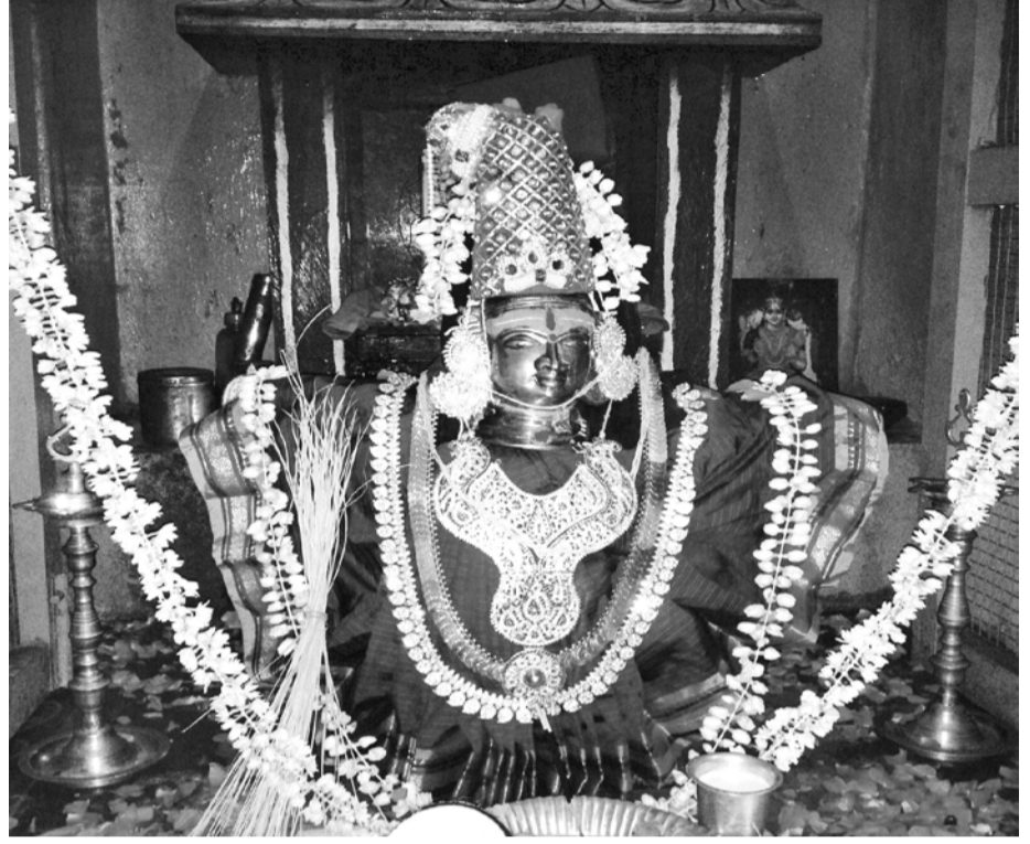
துளசி மடத்தை அலங்கரித்திருக்கும் காட்சி