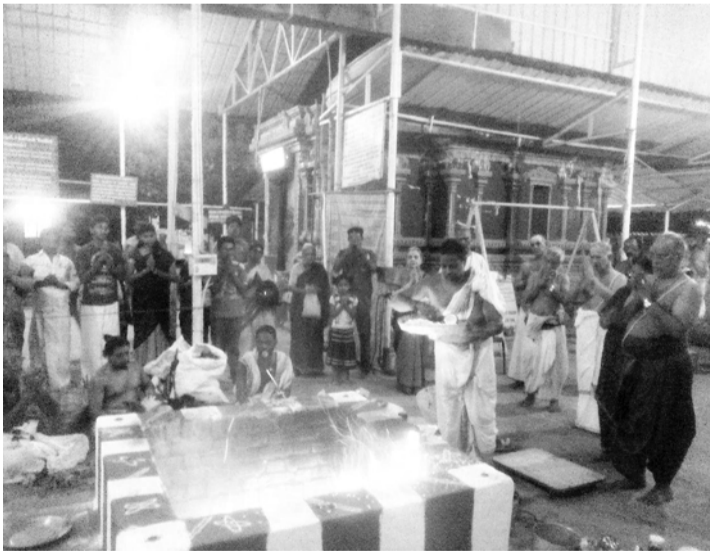
5-7-2015 குருபெயர்ச்சியன்று குரு ஹோமத்தில் பூர்ணாஹுதி காட்சி

16-8-2015 அன்று மாடம் பாக்கம், சக்திபீடத்தில் ஆடிப்பூரவிழா மிக விமரிசையாக நடைபெற்றது. திரளான சுவாசினிகள் செளபாக்ய திரவியங்கள் பெற்று பலன் அடைந்தார்கள். அன்னதானம் சிறப்பாக நடைபெற்றது. அதே நாளில் மும்பையில் புரவலர்கள் அனைவரும் சேர்ந்து ஏற்பாடு செய்திருந்த முலண்ட் பஜன் சமாஜத்தில் ஆடிப்பூர விழா மிகச் விமரிசையாக நடைபெற்றது.