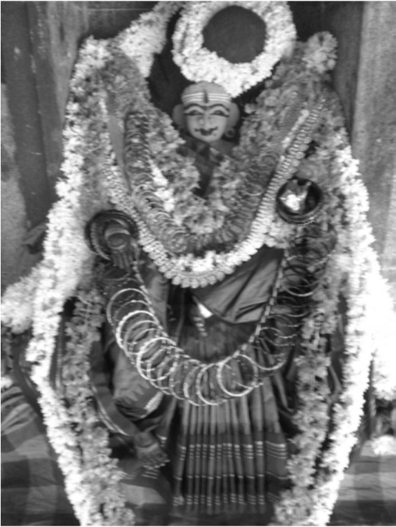
ராஜகாளியம்மனை அலங்கரித்திருக்கும் காட்சி