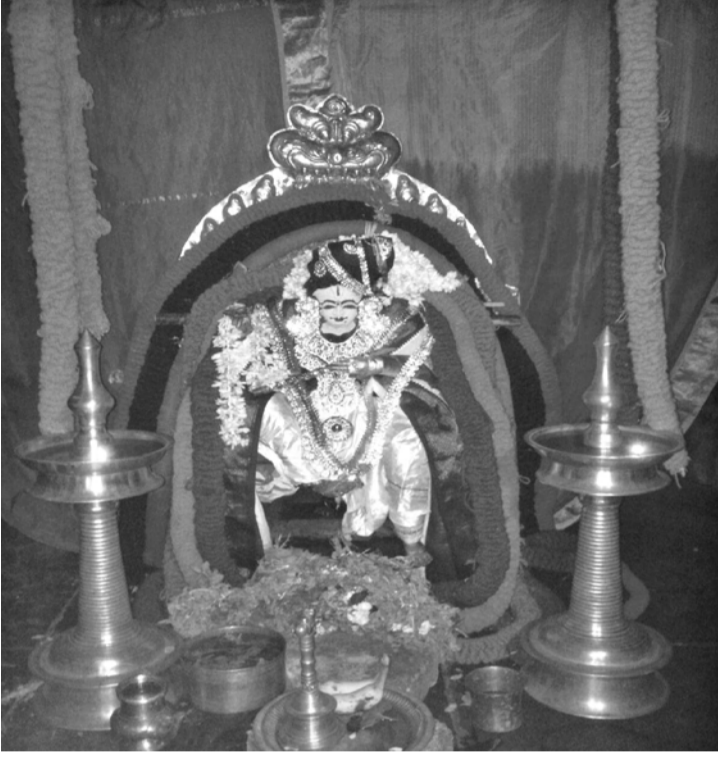
கிருஷ்ணரை அலங்கரித்திருக்கும் காட்சி